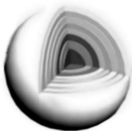
Рис.2. Волновая модель «элементарных частиц»

Те из них, которые имеют субатомные размеры, оставляют точечный след в камере Вильсона или на фотоэмульсии и потому принимаются нами за частицы. Таковы, по всей вероятности, не только электроны, но и другие так называемые «элементарные» частицы. Их целесообразно называть «волной-частицей», поскольку они подобно солитонам обладают частицеподобными свойствами и в этом отношении отражают дуализм их свойств в прямом, а не только переносном смысле.